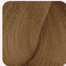
7WN Warm Natural Blonde