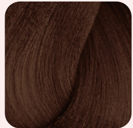
5WN Light Warm Natural Brown