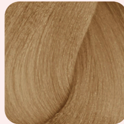
8WN Light Warm Natural Blonde